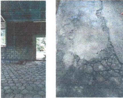
Foto 3: Sustitución de piso cerámico por adoquín en escenario de salón y sustitución de piso de torta de concreto en salón