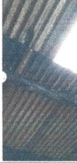
Foto 1: Sustitución de estructura de soporte de madera, por metal